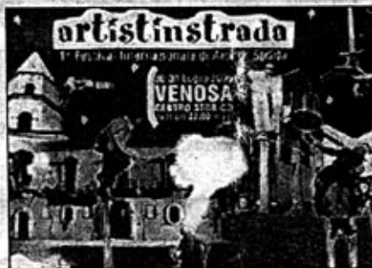
Il manifesto dell'evento