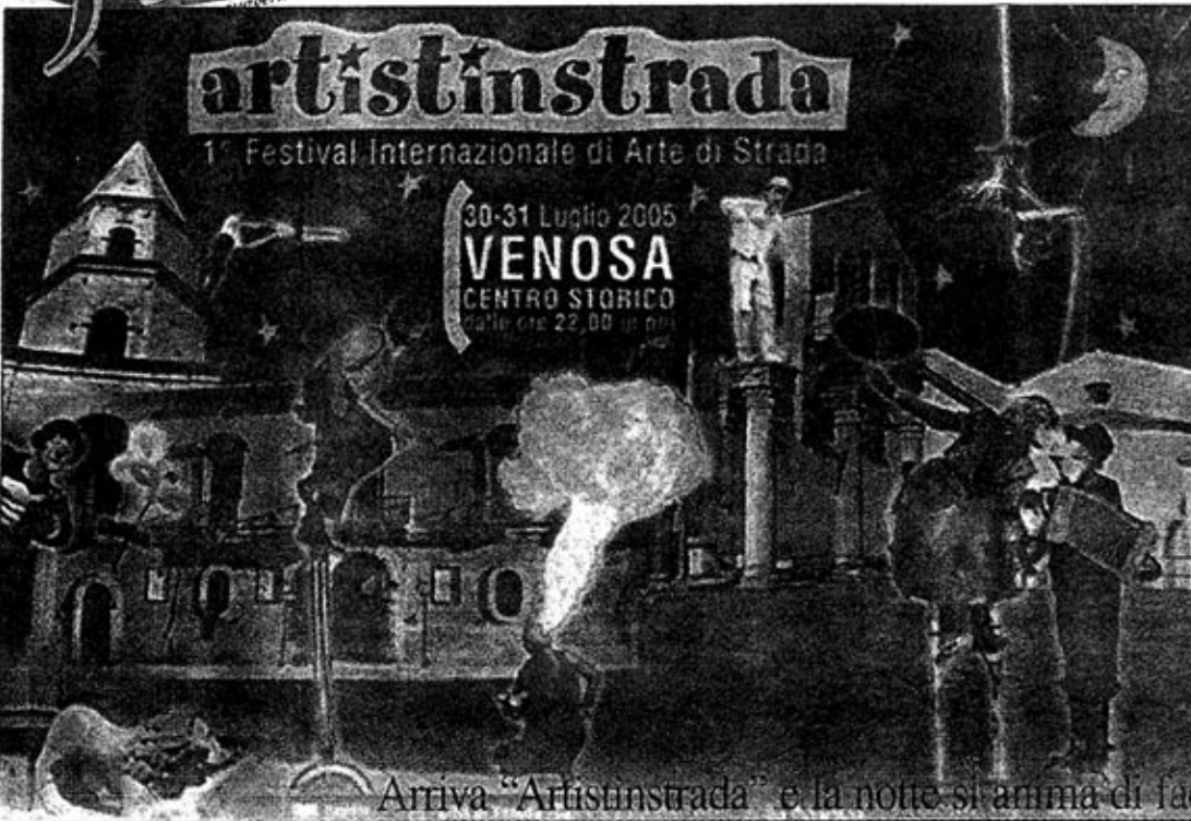
Arriva "Artistin strada" e la notte si anima di fachiri, giocolieri e sputafuoco

VENOSA. Un grande palcoscenico per un grande evento, nel cuore di Venosa, un mélange di circo, danza, musica, acrobazia, teatro.